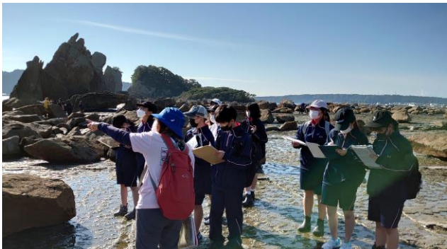
橋杭岩でのガイドさんの説明