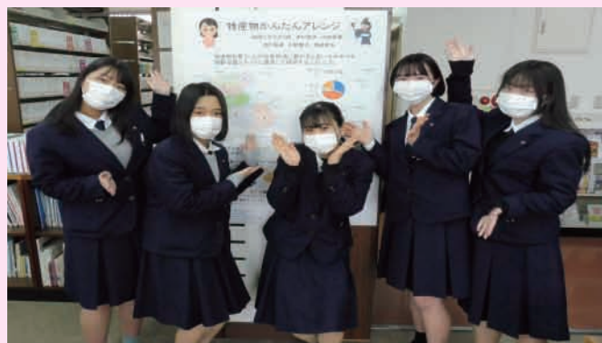
★★ 分野代表 B03班 ★★