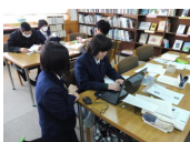
2学年(授業・中間発表会)