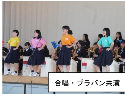
合唱・ブラバン共演