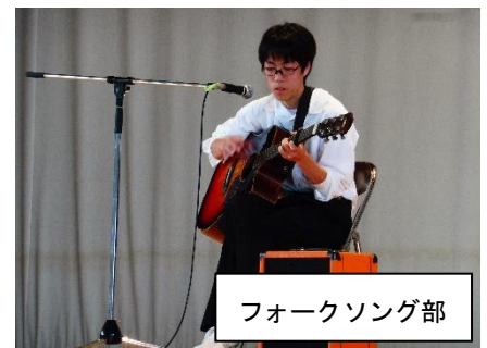
フォークソング部