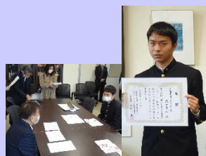
表彰を受ける出口くん