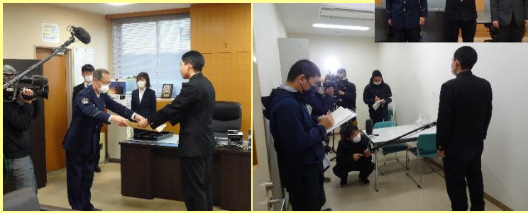
御坊署長から感謝状を受ける様子 記者から取材を受ける様子