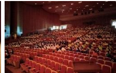
多くの他府県のみなさんが来てくれました。