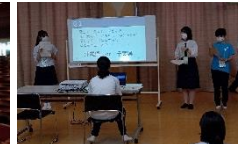
生徒交流会司会をしました。