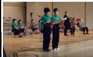
ギターマンドリン部の生徒が司会をしました。