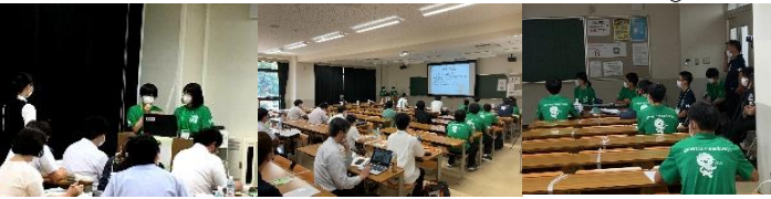
本校生徒2組が化学部門で発表しました。大会運営にも携わりました。