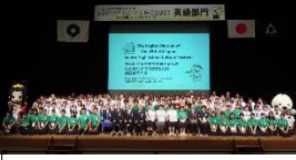
県外の生徒と英語を通して交流しました。