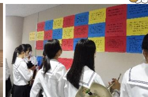
和歌山県豆知識を作成し全国の高校生と交流しました。