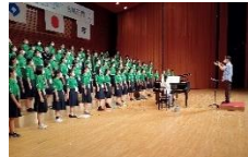
初演「ここ・いま・春」を演奏しました。

3年生は和歌山県合同チームで「さまざまな時の流れ」を表現した「流々(りゅうりゅう)」という曲を演奏しました。 1・2年生は式典、舞台進行・誘導等の大会運営に携わりました。