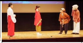
かぐや姫が月に帰る場面