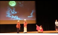
かぐや姫の物語を英語で演じました。

＜本校英語劇の一節から かぐや姫が月に帰る場面＞ Mother and Father, this is goodbye . Remember me every time you see the moon.