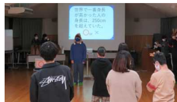
親睦会(クリスマス会)