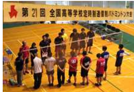
(写真は令和元年度出場時のもの)